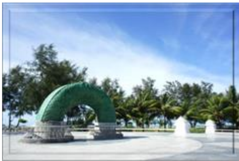
ประติมากรรมส่วนสะดือพญานาค

1) ส่วนหัวพญานาค ประติมากรรมส่วนหัวพญานาคนี้ ตั้งอยู่บริเวณสวนสองทะเล ปลายแหลมสนอ่อน มีขนาด เส้นผ่าศูนย์กลางของลำตัว 1.20 เมตร และความสูงจากฐานลำตัวจนถึงปลายยอดสุดประมาณ 9 เมตร โดยสร้างหันหน้าและพ่นน้ำ ลงสู่ปากอ่าวทะเลสาบ สงขลา