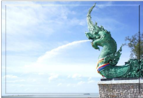
ประติมากรรมส่วนหัวพญานาค

4.7) ประติมากรรมพญานาคพ่นน้ำประติมากรรมพญานาคพ่นน้ำเป็นสัญลักษณ์หนึ่งของจังหวัดสงขลามีลักษณะแบบลอยตัวสามารถมองเห็นได้รอบด้าน เนื้อวัตถุเป็นโลหะทองเหลืองรมสนิมเขียว ออกแบบโดยอาจารย์มนตรี สังข์มุสิก้า โดยได้จัดสร้างขึ้นเป็น 3 ส่วน ประกอบด้วย คือ