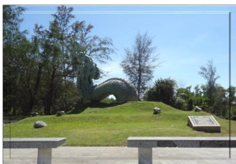
ประติมากรรมส่วนหางพญานาค

2) ส่วนสะดือพญานาค ประติมากรรมส่วนที่สอง “สะดือพญานาค” ตั้งอยู่ในบริเวณลานชมดาว สนามสระบัว แหลมสมหลามีขนาดเส้นผ่าศูนย์กลางของ ลำตัว 1.20 เมตร ยาว 5 เมตร และสูง 2.50 เมตร ลักษณะลำตัวโค้งเป็นรูปครึ่งวงกลม ทั้งนี้เพื่อให้ ประชาชนและนักท่องเที่ยวได้ลอดใต้สะดือพญานาค อันจะเป็นการช่วยเสริมความเป็นสิริมงคลให้แก่ตนเอง